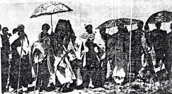
ታቦቷ ከመቃኛው ወጥቶ ወደ አደሬ ቤተ ክርስቲያን ሰጥቷል

ጥላ ገዘቹ አመጣለው በማለት ተሰለው ሳለ ልጃቸው እግራሲያን ሳይሆን ጠጠሩ ስለመጣለትና ጠጠሩ ስለሆነ የተሳሉትን ይዘው በ፲፱፻፸፭ ዓ ም የካቲት ፲፮ ተን ከቦታው በመገኘት በዓልን እክብረዋል። ወር ፳፬ ተረፈ በዚህ