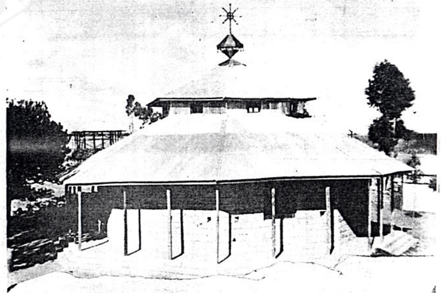
የደብረ ሰዋከው ቅድስት ክፍያ ምኒረት ቤተ ክርስቲያን