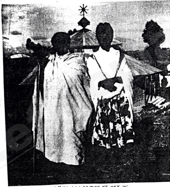
ወር ፳፬ ተረፈ ከግራኝ የሰዎች ወር